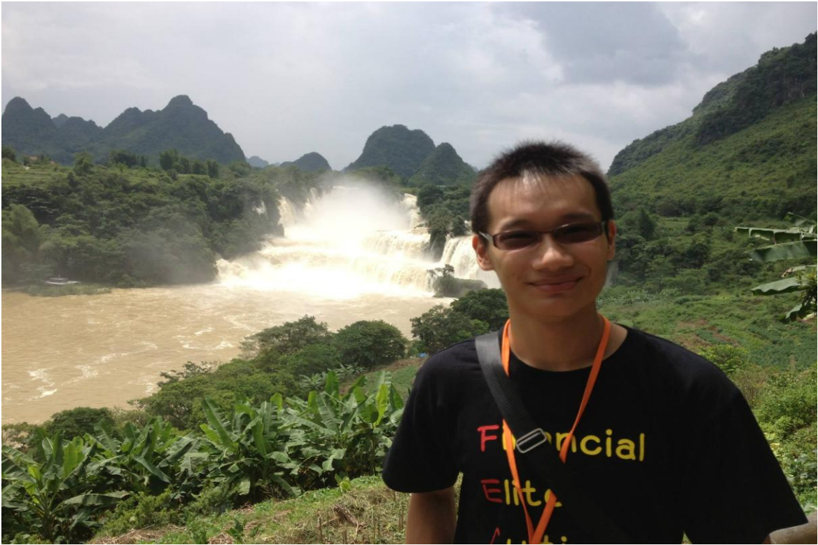
廣西桂林的山水，百聞不如一見。

「讀萬卷書，不如行萬里路；行萬里路，不如閱人無數；閱人無數，不如高人指路；高人指路，還得自己去悟！」從我第一次參加賢德惜福文教基金會的團以來，這是影響我最深的一句話，它告訴我學習的重要，不論是書本上、旅途中，還是來自老師、朋友或甚至不認識的人，都有很多值得我學習的東西，而這次廣西行也是改變我最深、學習收穫最多的一次。